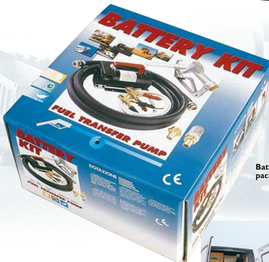
Battery kit packaging