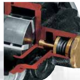
E 80 - E 120 By pass